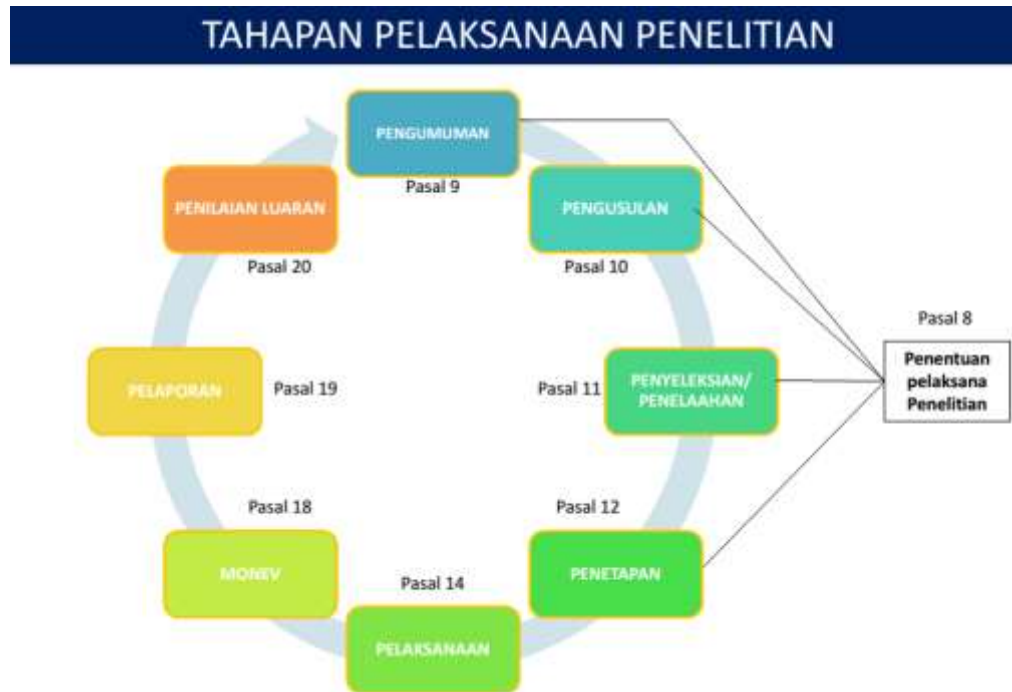
Gambar 1.1 Tahapan Pelaksanaan Penelitian sesuai Permenristekdikti Nomor 20 Tahun 2018

peraturan tersebut, ada delapan tahapan pelaksanaan penelitian seperti disajikan dalam Gambar 1.1 berikut ini.